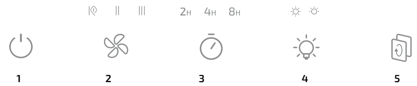
Fig./Img./Abb./Afb./ Rys./Obr. 2