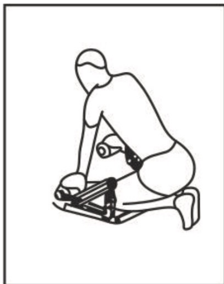
Fig. / Img. / Rys. / Obr. 5