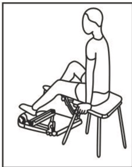
Fig. / Img. / Rys. / Obr. 1