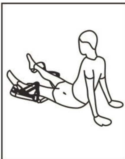
Fig. / Img. / Rys. / Obr. 4