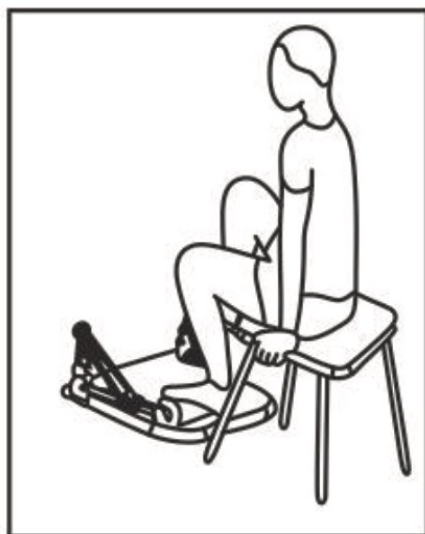
Fig. / Img. / Rys. / Obr. 2